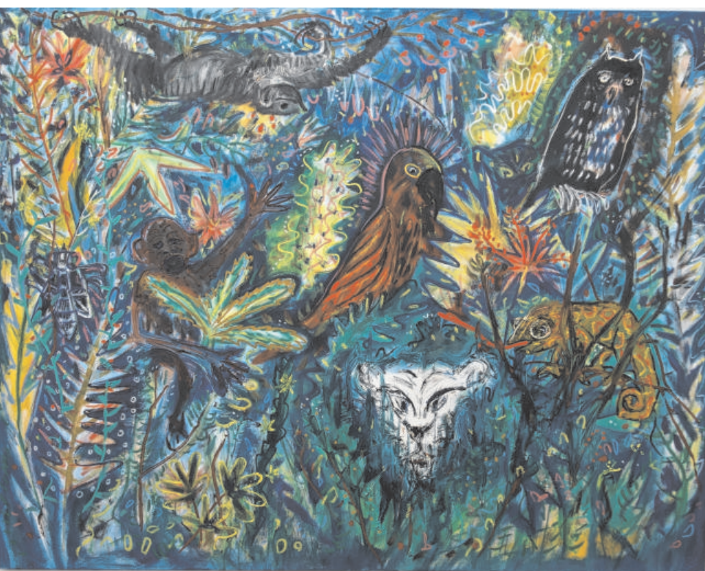
Bild mit langem Titel: „Sehr seltene Tierfreunde treffen sich im Dschungel und denken über morgen nach“ (Öl, Ölkreide und Acryl auf Leinwand, 140 x 180 cm).